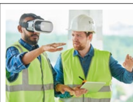
Digital Experience Center(s) Gebouwde Omgeving

Onderzoek naar de opzet van een Digital Experience Center Gebouwde Omgeving.